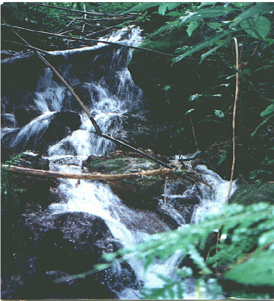
Rio "La Dicha" El Cornelio, Acosta

El inicio de la existencia del hombre se remonta hace millones de años. Fue lenta la evolución. Así que al llegar a la Revolución Francesa con la aparición de la imprenta, las máquinas de vapor, la electricidad y las máquinas de gasolina el desarrollo de muchas ciudades se acrecentó y con ella vino el bienestar la comodidad y las industrias proliferaron.