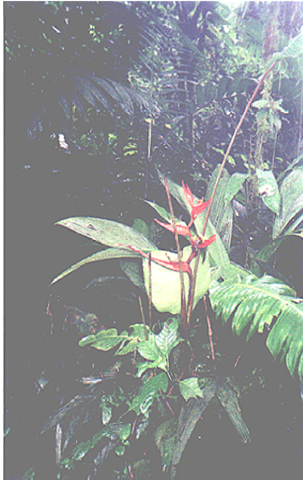
“Platanilla” Eliconia latisphata , El Cornelio, Acosta.

traer el agua. Desaparece el bosque, desaparece la vida, desaparece la especie humana, todo desaparece. Sin embargo estamos a tiempo de corregir nuestro error y dejarle a los del futuro un mundo mejor. Como los antepasados nos dejaron a nosotros y así manifestar al mundo que en