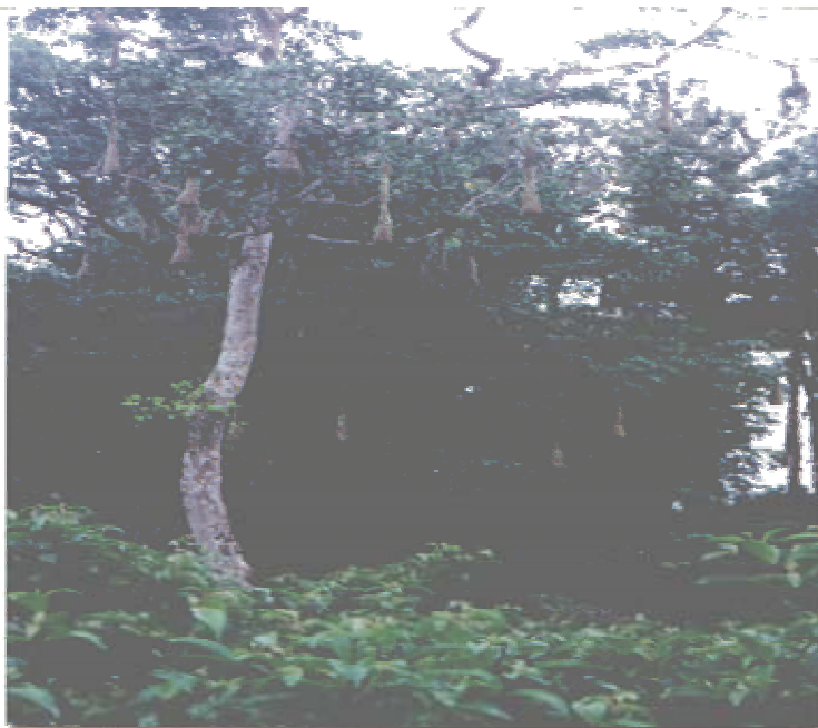
Nidos de “Oropéndola” Psarocolius Montezuma , El Cornelio